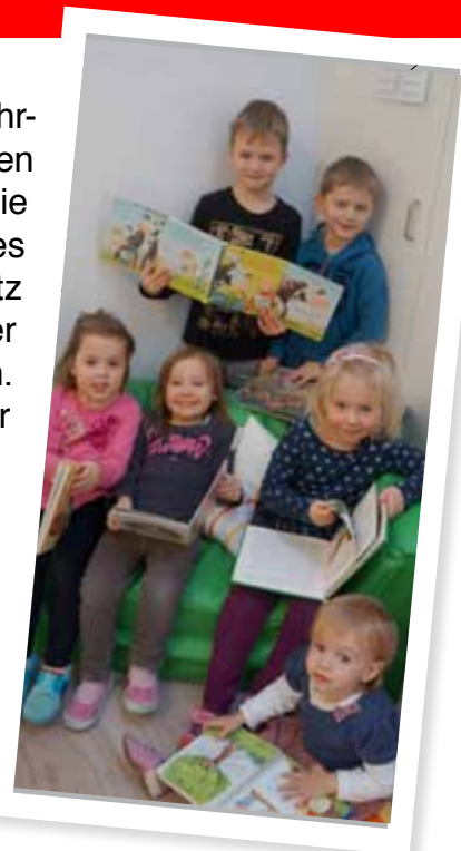
Kindergarten- Kinder

Bei Terminproblemen bitte ich Sie um eine telefonische Terminvereinbarung unter 07947/6419.