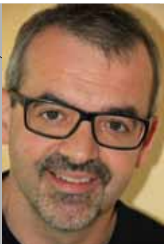
Bruno Fröhlich

Stellvertretend für viele, die Barmherzigkeit leben, erzählen in dieser Pfarrblattausgabe Menschen aus unserer Pfarre vor allem über dieses aktive Element der Barmherzigkeit.