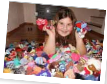
Häubchenausbeute; Foto: Sonja Steinmetz