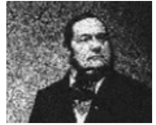
Adalbert Stifter

Bei einem Festakt am 7. November 2015 in der Kirche wurde vor allem aus seinem Bildungsroman „Nachsommer“ gelesen und mit Orgelmusik von Anton Bruckner wurde an den großen Dichter und Denkmalschützer zu seinem 210. Geburtstag gedacht. Im Festsaal der Gemeinde wurde eine Ausstellung mit einer eindrucksvollen Bildpräsentation über die Moldau mit Musik von B. Smetana eröffnet.