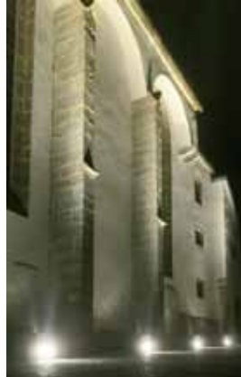
Kirche in neuem Licht