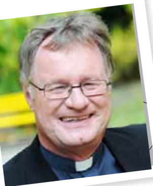
Bischof Manfred Scheuer; Foto: privat

Spiritus vivificat- der Geist macht lebendig.(Joh 6,63)